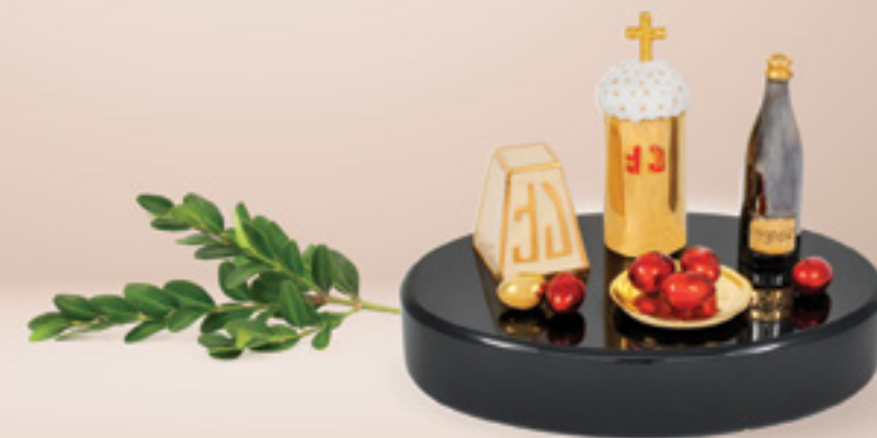
სააღდგომო პასკა EASTER CAKE PASKA 311109

თითბერი | Brass მოჭოროვილი | Gold plated 24K ცივი მინანქარი | Cold enamel ობსიდიანი | Obsidian stand სიგრძე | Length: 6 სმ | cm სიმაღლე | Height: 6 სმ | cm