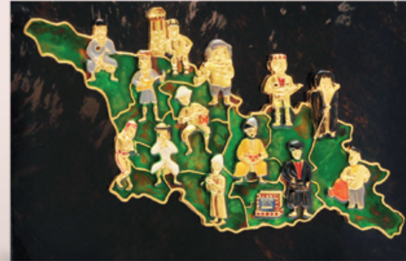
საქართველოს რუკა GEORGIAN MAP 39139

თითბერი | Brass მოქროვილი | Gold plated 24K ცივი მინანქარი | Cold enamel ობსიდიანი | Obsidian stand სიგრძე | Length: 17 სმ | cm სიმაღლე | Height: 7 სმ | cm