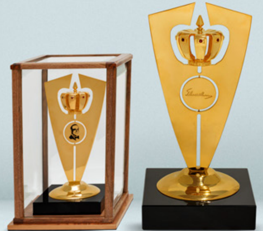
საჭადრაკო ტურნირის ჯილდო CHESS TOURNAMENT AWARD

თითბერი | Brass მოჭროვილი 24K | Gold plated 24K ცივი მინანქარი | Cold enamel ობსიდიანი | Obsidian