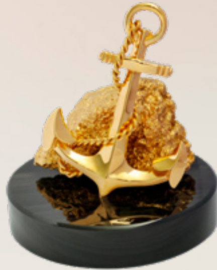
ღუზა ANCHOR 311292

თითბერი | Brass მოქროვილი | Gold plated 24K ოქსიდიანი | Obsidian stand სიგრძე | Length: 13 სმ | cm სიმაღლე | Height: 14 სმ | cm