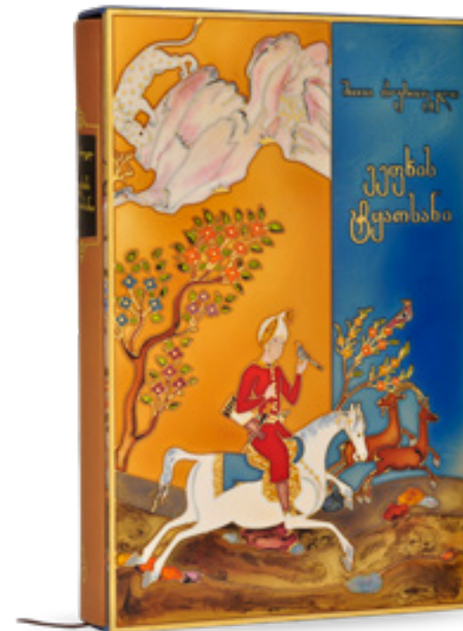
ვეფხისტყაოსანი THE KNIGHT IN THE PANTHER'S SKIN 37919 თითბერი | Brass მოთქროვილი | Gold plated 24K ცივი მინანქარი | Cold enamel სიგრძე | Length: 14 სმ | cm სიმაღლე | Height: 20.5 სმ | cm