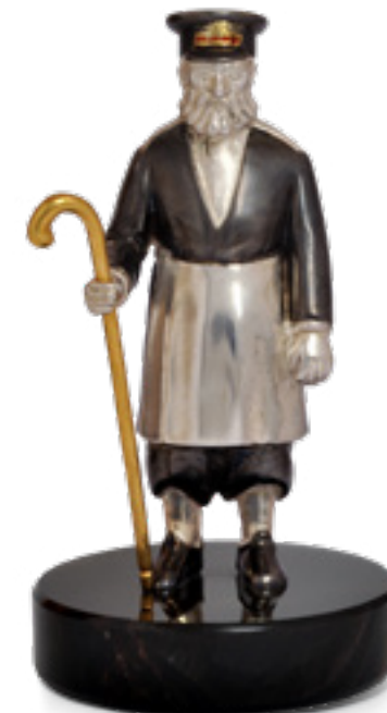
ფიროსმანის მეთევზე FISHERMAN OF PIOSMANI 36536

თითბერი | Brass მოთქროვილი | Gold plated 24K მოვერცხლილი | Silver plated ცივი მინანქარი | Cold enamel ოქსიდიანი | Obsidian stand სიგრძე | Length: 8.5 სმ | cm სიმაღლე | Height: 13 სმ | cm