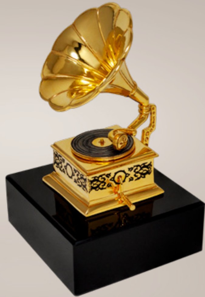
ფირსაკრაპი GRAMOPHONE 311271

თითბერი | Brass მოთქროვილი | Gold plated 24K ობსიდიანი | Obsidian stand სიგრძე | Length: 8.5 სმ | cm სიმაღლე | Height: 13 სმ | cm