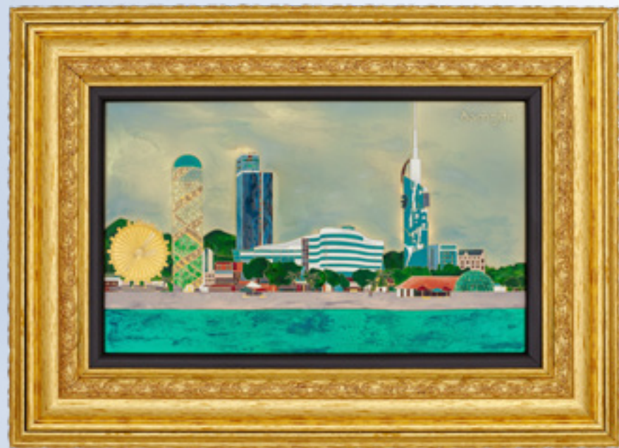
მინაქრის კომპოზიცია ბათუმი ENAMEL COMPOSITION BATUMI 311642

თითბური | Brass მოქროვილი | Gold plated 24K ცივი მინაქარი | Cold enamel