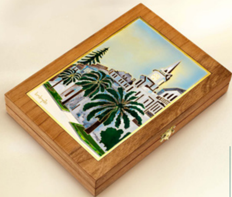
ნარდი სოხუმი BACKGAMMON SOKHUMI 311636

თიბერი | Brass მოქროვილი | Gold plated 24K ცივი მინანქარი | Cold enamel დაფის ზომა | Board size სიგრძე | Length: 24 სმ | cm სიგანე | Width: 16 სმ | cm