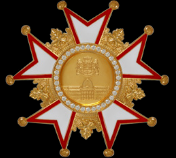
ბრწყინვალების ორდენი ORDER OF EXCELLENCE ვერცხლი 925 | Sterling silver 925 მოქროვილი | Gold plated 24K ცივი მინანქარი | Cold enamel