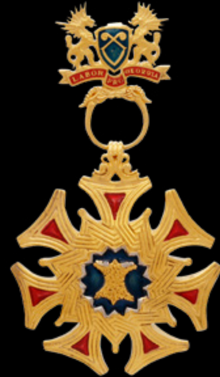
ორდენი ოქროს საწმისი ORDER OF THE GOLDEN FLEECE მოქროვილი | Gold plated 24K ცივი მინანქარი | Cold enamel