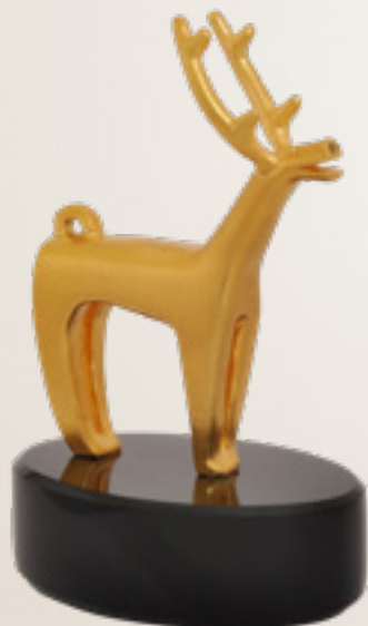
მცხეთის ირემი DEER FROM MTSKHETA ARCHAEOLOGICAL EXCAVATIONS 34499

თითბერი | Brass მოქროვილი | Gold plated 24K ობსიდიანი | Obsidian stand სიგრძე | Length: 6 სმ | cm სიმაღლე | Height: 9 სმ | cm