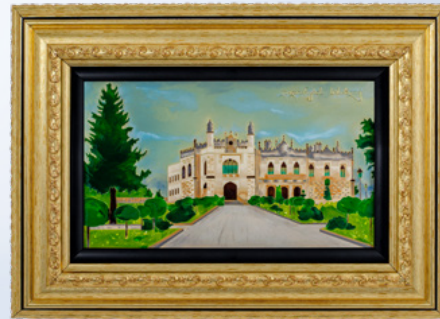
მინაქრის კომპოზიცია დადიანების სასახლე ENAMEL COMPOSITION PALACE OF DADIANI 311646

თითბური | Brass მოქროვილი | Gold plated 24K ცივი მინაქარი | Cold enamel