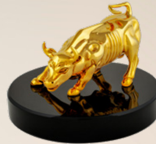
უოლ სტრიტის ხარი BULL OF WALL STREET 3113147

თითბერი | Brass მოქროვილი | Gold plated 24K ოქსიდიანი | Obsidian stand სიგრძე | Length: 6 სმ | cm სიმაღლე | Height: 6 სმ | cm