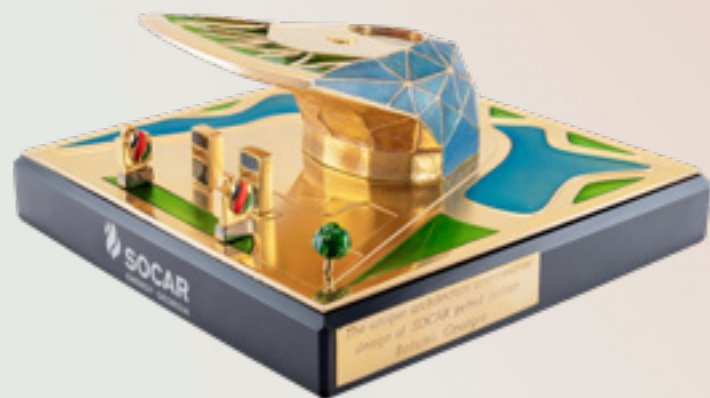
სოკარის ბენზინგასამართი სადგური SOCAR GAS STATION

თითბერი | Brass მოთქროვილი | Gold plated 24K ცივი მინანქარი | Cold enamel ობსიდიანი | Obsidian stand