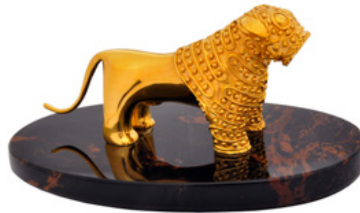
წმორის ლომი TSNORI LION 33657

თითბერი | Brass ქვა | Stone: ფირუზი | Turquoise ცივი მინანქარი | Cold enamel ობსიდიანი | Obsidian stand სიგრძე | Length: 17 სმ | cm სიმაღლე | Height: 16 სმ | cm