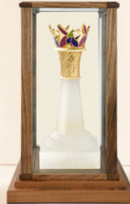
ჭადრაკის მეფე- ლაზიერი KING OF CHESS – QUEEN

თითბერი | Brass მოქროვილი | Gold plated 24K ცივი მინანქარი | Cold enamel ონიქსი | Onyx