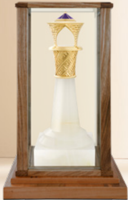
ჭადრაკის მეფე- ლაზიერი KING OF CHESS – QUEEN

თითბერი | Brass მოქროვილი | Gold plated 24K ცივი მინანქარი | Cold enamel ონიქსი | Onyx