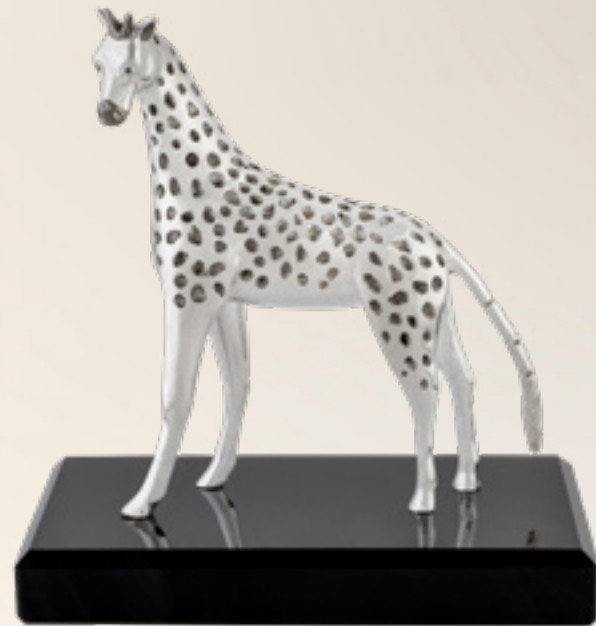
ფიროსმანის ჟირაფი GIRAFFE OF PIROSMANI 311405

თითბერი | Brass მოქროვილი | Gold plated 24K ცივი მინანქარი | Cold enamel ობსიდიანი | Obsidian stand სიგრძე | Length: 9 სმ | cm სიმაღლე | Height: 10 სმ | cm