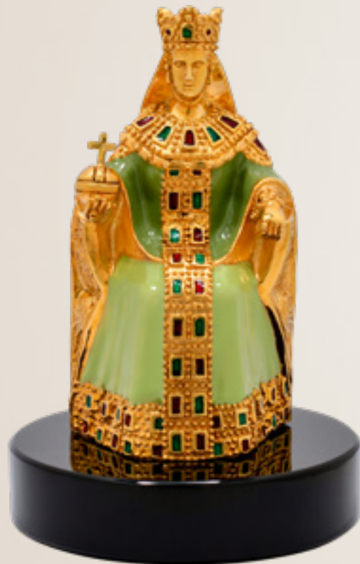
თამარ მეფე KING TAMAR 310984

თითბერი | Brass მოქროვილი | Gold plated 24K ცივი მინანქარი | Cold enamel ობსიდიანი | Obsidian stand სიგრძე | Length: 7 სმ | cm სიმაღლე | Height: 11 სმ | cm