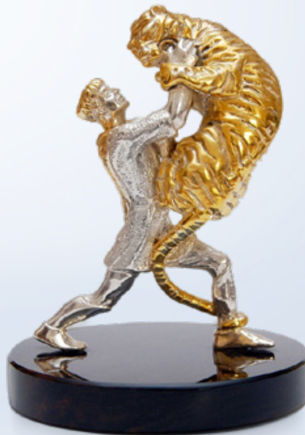
ტარიელის და ვეფხის შერკინება SCRAMBLE OF THE KNIGHT AND TIGER 38397

თითბერი | Brass მოქროვილი | Gold plated 24K ობსიდიანი | Obsidian stand სიგრძე | Length: 8 სმ | cm სიმაღლე | Height: 11 სმ | cm