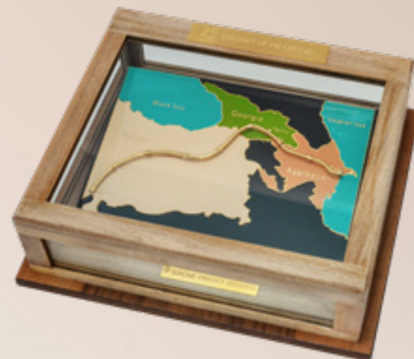
ბაქო-თბილისი-ჯეიჰანის მილსადენი BAKU-TBILISI-CEYHAN PIPELINE

თითბერი | Brass მოთქროვილი | Gold plated 24K ცივი მინანქარი | Cold enamel ობსიდიანი | Obsidian stand