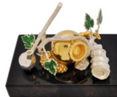
რთველი RTVELI 34340

თითბერი | Brass მოვერცხლილი | მოქროვილი Silver plated | Gold plated 24K ცივი მინანქარი | Cold enamel ობსიდიანი | Obsidian stand სიგრძე | Length: 9 სმ | cm სიმაღლე | Height: 5 სმ | cm