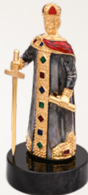
დავით აღმაშენებელი KING DAVID THE BUILDER 310985-1

თითბერი | Brass მოქროვილი | Gold plated 24K ცივი მინანქარი | Cold enamel ობსიდიანი | Obsidian stand სიგრძე | Length: 7 სმ | cm სიმაღლე | Height: 11 სმ | cm