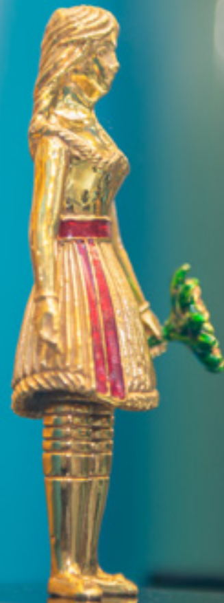
ფიროსმანის მარგარიტა ACTRESS MARGARITA OF PIOSMANI 37548

თითბერი | Brass მოთქროვილი | Gold plated 24K ცივი მინანქარი | Cold enamel ოქსიდიანი | Obsidian stand სიგრძე | Length: 8.5 სმ | cm სიმაღლე | Height: 12 სმ | cm