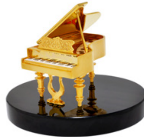
როიალი GRAND PIANO 310924

თითბერი | Brass მოთქროვილი | Gold plated 24K ობსიდიანი | Obsidian stand სიგრძე | Length: 8.5 სმ | cm სიმაღლე | Height: 13 სმ | cm