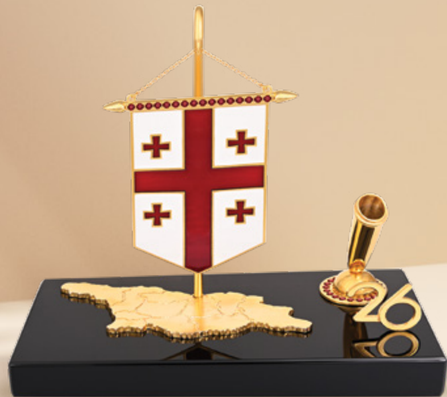
საქართველოს დროშა საკალმით GEORGIAN FLAG WITH A PEN 311653

თითბერი | Brass ძონი | 37 ც | 5.27 კტ. | მრგვალი Garnet | 37 pcs | 5.27 Ct. | Round მოთქროვილი 24K | Gold plated 24K ობსიდიანი | Obsidian