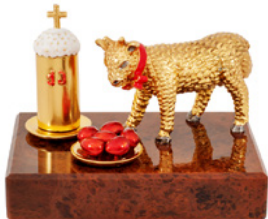
სააღდგომო ცხვარი EASTER SHEEP 310878

თითბერი | Brass მოჭოროვილი | Gold plated 24K ცივი მინანქარი | Cold enamel ობსიდიანი | Obsidian stand სიგრძე | Length: 9 სმ | cm სიმაღლე | Height: 8 სმ | cm