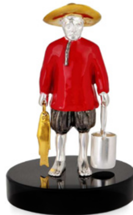
ფიროსმანის მეთევზე FISHERMAN OF PIOSMANI 33566

თითბერი | Brass მოთქროვილი | Gold plated 24K ცივი მინანქარი | Cold enamel ოქსიდიანი | Obsidian stand სიგრძე | Length: 8.5 სმ | cm სიმაღლე | Height: 12 სმ | cm