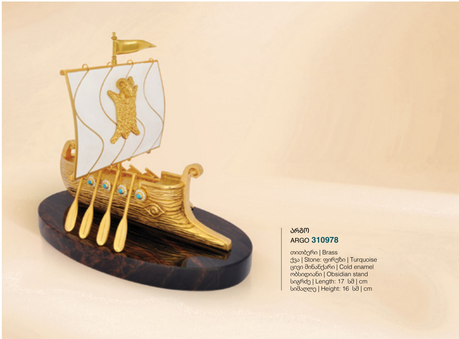
არგო ARGO 310978

თითბერი | Brass ქვა | Stone: ფირუზი | Turquoise ცივი მინანქარი | Cold enamel ობსიდიანი | Obsidian stand სიგრძე | Length: 17 სმ | cm სიმაღლე | Height: 16 სმ | cm