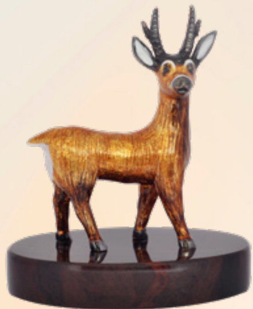
ფიროსმანის ირემი DEER OF PIROSMANI 38347

თითბერი | Brass მოქროვილი | Gold plated 24K ცივი მინანქარი | Cold enamel ობსიდიანი | Obsidian stand სიგრძე | Length: 9 სმ | cm სიმაღლე | Height: 10 სმ | cm