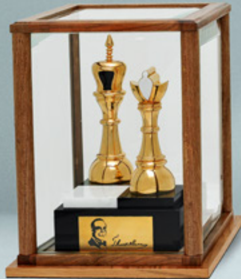
საჭადრაკო ტურნირის ჯილდო CHESS TOURNAMENT AWARD

თითბერი | Brass მოჭროვილი 24K | Gold plated 24K ცივი მინანქარი | Cold enamel ობსიდიანი | Obsidian