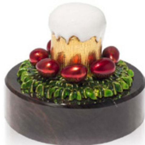
სააღდგომო პასკა EASTER CAKE PASKA 38338

თითბერი | Brass მოჭოროვილი | Gold plated 24K ცივი მინანქარი | Cold enamel ობსიდიანი | Obsidian stand სიგრძე | Length: 9 სმ | cm სიმაღლე | Height: 8 სმ | cm