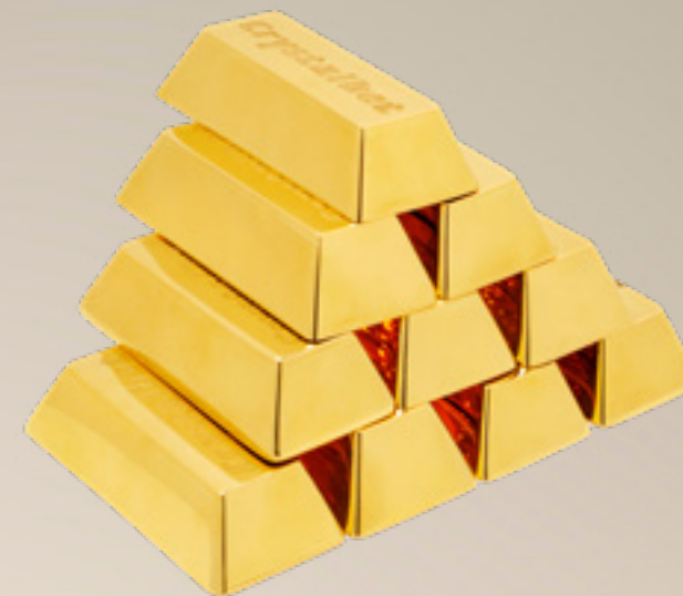
ოქროს ზოლი GOLD BAR

თითბერი | Brass მოთქროვილი | Gold plated 24K ცივი მინანქარი | Cold enamel ობსიდიანი | Obsidian stand