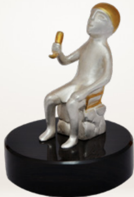
ვანის თამადა TAMADA FROM VANI ARCHAEOLOGICAL EXCAVATIONS 36118

თითბერი | Brass მოქროვილი | Gold plated 24K ობსიდიანი | Obsidian stand სიგრძე | Length: 6 სმ | cm სიმაღლე | Height: 9 სმ | cm