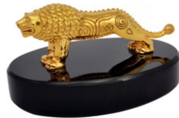
ჯაფარიძის ლომი JAPHARIDZE LION 38668

თითბერი | Brass მოქროვილი | Gold plated 24K ობსიდიანი | Obsidian stand სიგრძე | Length: 19 სმ | cm სიმაღლე | Height: 7 სმ | cm