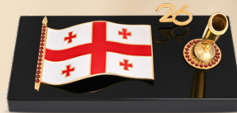
საქართველოს დროშა საკალმით GEORGIAN FLAG WITH A PEN 311653

თითბერი | Brass ძონი | 37 ც | 5.27 კტ. | მრგვალი Garnet | 37 pcs | 5.27 Ct. | Round მოთქროვილი 24K | Gold plated 24K ობსიდიანი | Obsidian