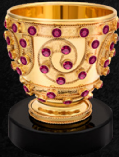
თრიალეთის თასი THE TRIALETI CHALICE 35089

თითბერი | Brass მოქროვილი | Gold plated 24K ცივი მინანქარი | Cold enamel ობსიდიანი | Obsidian stand სიგრძე | Length: 10 სმ | cm სიმაღლე | Height: 9.5 სმ | cm