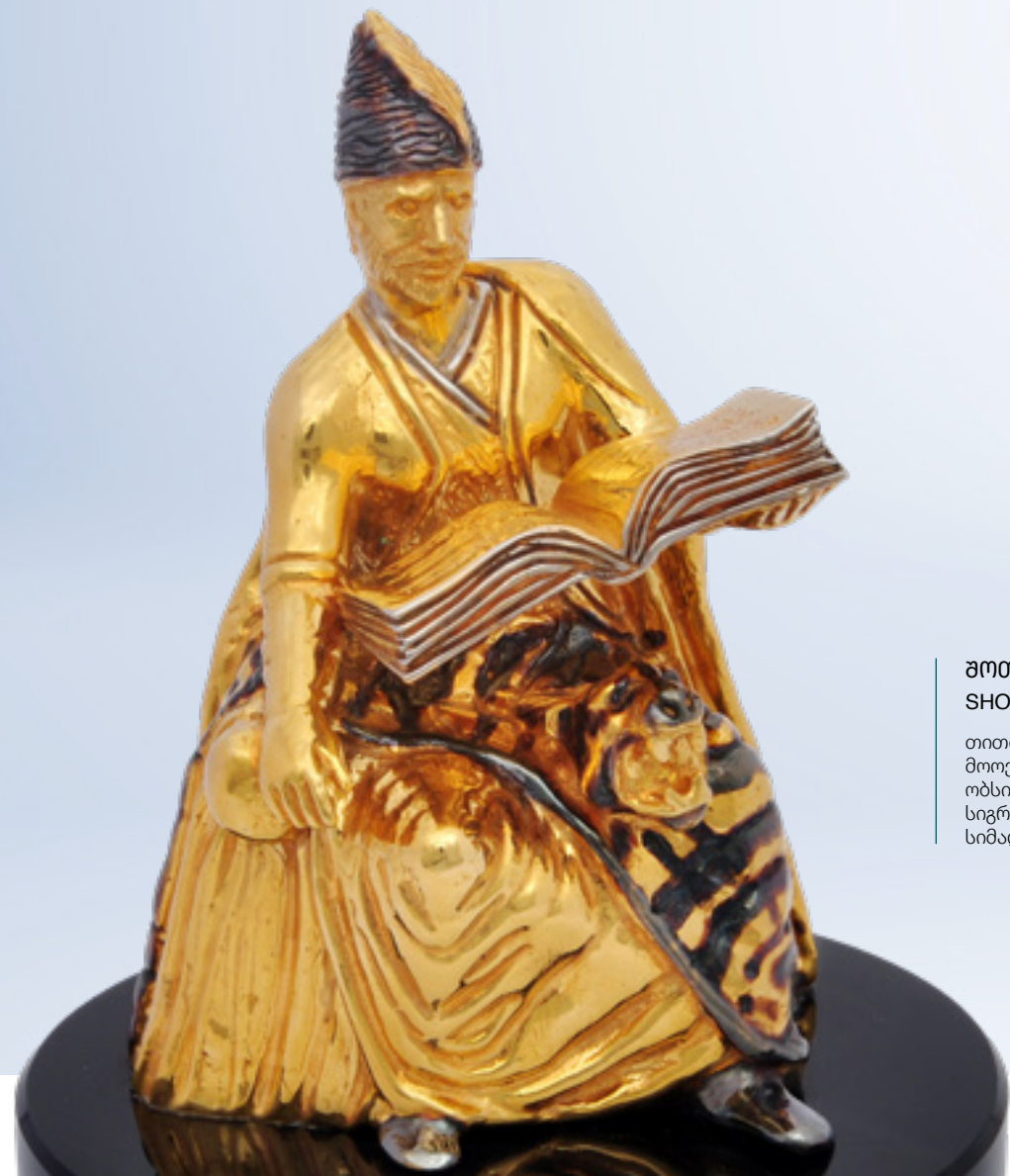
შოთა რუსთაველი SHOTA RUSTAVELI 38397

თითბერი | Brass მოქროვილი | Gold plated 24K ობსიდიანი | Obsidian stand სიგრძე | Length: 8 სმ | cm სიმაღლე | Height: 11 სმ | cm