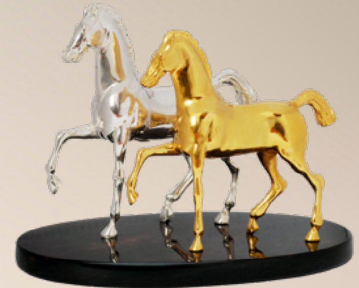
ცხენი HORSE 36393

თითბერი | Brass მოქროვილი | Gold plated 24K ოქსიდიანი | Obsidian stand სიგრძე | Length: 10 სმ | cm სიმაღლე | Height: 8 სმ | cm