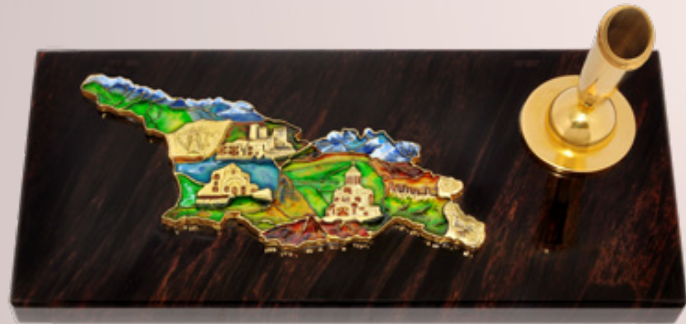
საქართველოს რუკა საკალმით GEORGIAN MAP WITH PEN HOLDER 38406

თითბერი | Brass მოქროვილი | Gold plated 24K ცივი მინანქარი | Cold enamel ობსიდიანი | Obsidian stand სიგრძე | Length: 17 სმ | cm სიმაღლე | Height: 7 სმ | cm