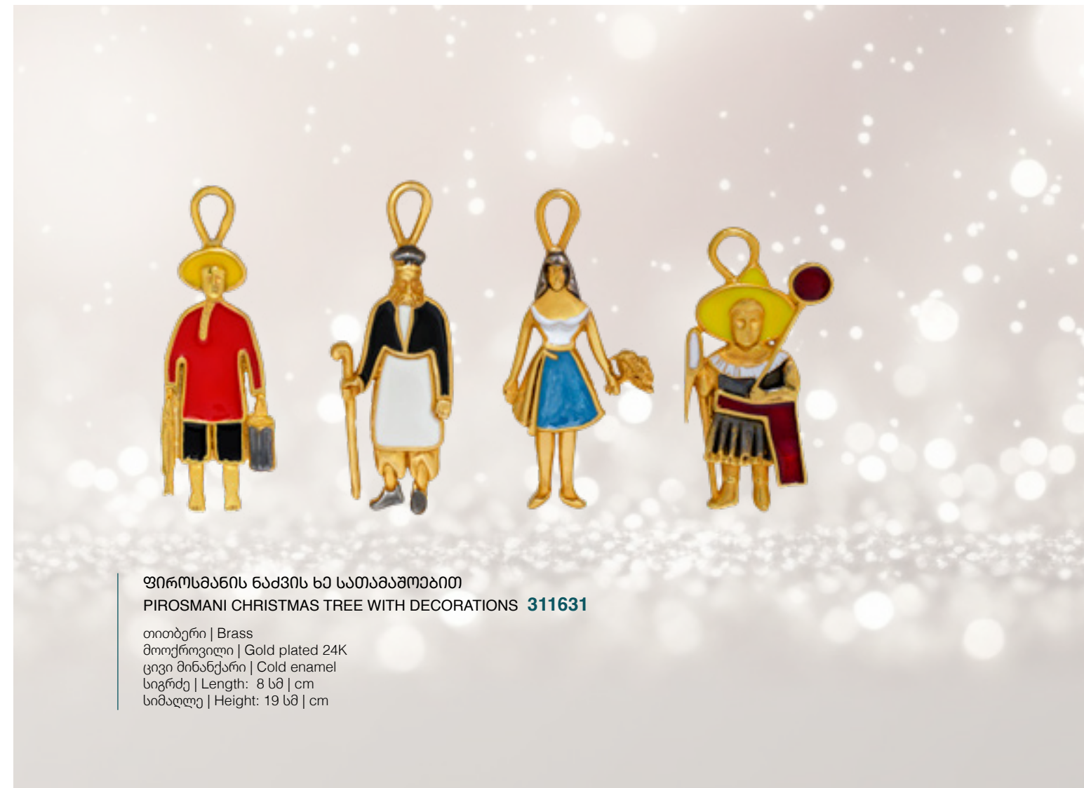
ფიროსმანის ნაძვის ხე სათამაშოებით PIROSMANI CHRISTMAS TREE WITH DECORATIONS 311631

თითბერი | Brass მოქროვილი | Gold plated 24K ცივი მინანქარი | Cold enamel სიგრძე | Length: 8 სმ | cm სიმაღლე | Height: 19 სმ | cm